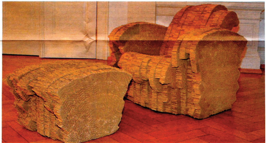
Wellpappe zum Ausruhen. Dieses Objekt steht direkt am Beginn des Ausstellungsweges.