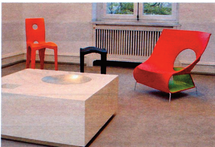
Schönes Wohnen ist auch in Pappmaché möglich, wie dieses Ensemble zeigt.